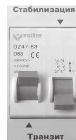
Рис. 8. Режим «Транзит»