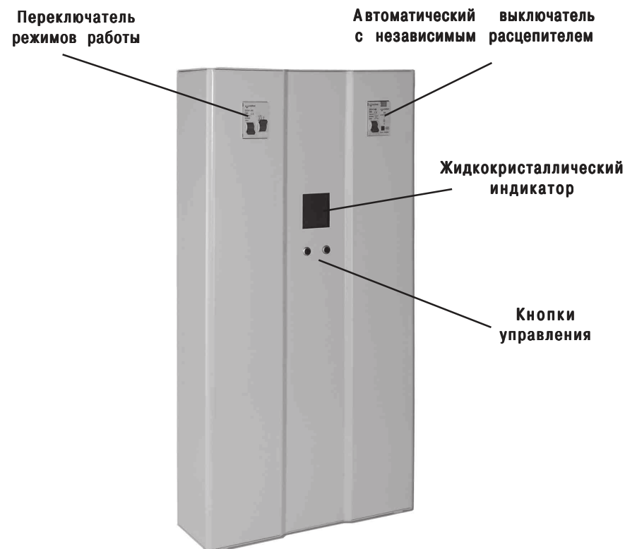
Рис. 1. Стабилизатор напряжения

В верхней части расположен клеммник, для подключения стабилизатора, закрытый крышкой. Там же расположен заземляющий контакт.